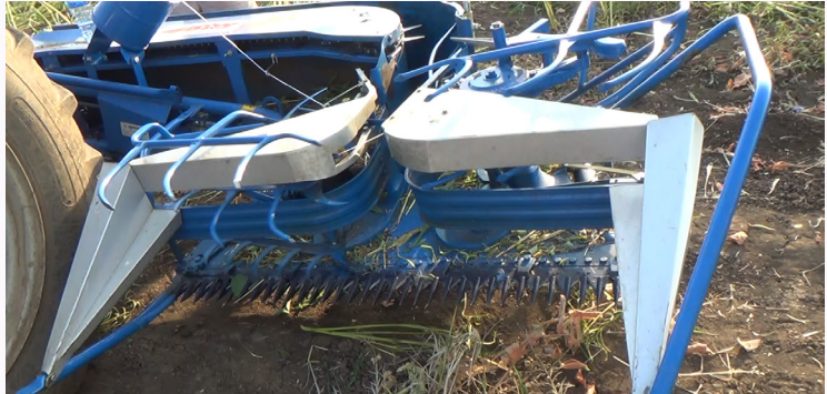
መዳርግቲ ኣካላት ምስ መንግስቲ ብምትሕብባር ንክጥቀሙሎም መንግስቲ ትግራይ ብፍላይ ዞባ ምዕራብ እናሰርሓ ይርከቡ።

ብምክንያት ተላባድነት ሕማም ኮሮና ቫይረስ ምንቅስቃስ መዓልታዊ ሰራሕተኛታት ተገዲቡ ይርከቡ። ኣብ ሰሜን ምዕራብ ኢትዮጵያ ዝርከቡ ናይ ሰሊጥ መፍረይቲ ሓረስቶት መሬቶም ንምድላዉ ሕፀረት ሰራሕተኛታት ኣጋጢሞዎም ይርከቡ። ሰሊጥ ንምፍራይ ክሳብ 70 መዓልታዊ ሰራሕተኛታት ንሓደ ሄክታር የድሊ። እዚ ቁፅሪ ኣብ ሰሜን ምዕራብ ኢትዮጵያ በቢዓመቱ ሰሊጥ ካብ ዝሸፈን መሬት (500000 ሄክታር) እንትረእ ብርክት ዝበለ ምዓልታዊ ሰራሕተኛ ነዚ ከባቢ ከምዘድልዮ የመላክት።