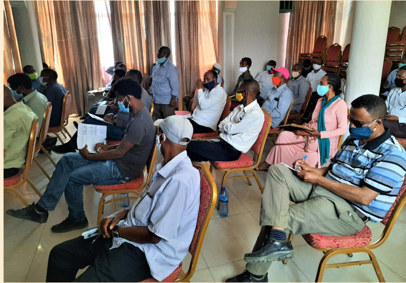
ምስ ናይ ክልልና መንግስቲ ብምዝርራብ መፍትሒ ንክግበረሉ ኣብቲ ዋሳ ዝተሳተፉ መፍረይቲ ገሊዮም።

ኮቪድ-19 ኣብ 2012/13 ምህርቲ ዘመን ኣብ ሕርሻ ዘብጸሉ ተፅዕኖ ቀሊል ከምዘይከውን ምግማት ይክእል እዩ። ብፍላይ ድማ ዝለዓለ ናይ ሰብ ጉልበት ንዝሓትት ናይ ሰሊጥ ሴክተር ዝግበዩ ተፅዕኖ ከብጸሉ ከምዝክእል ይፍለጥ። ናይቲ ምይይጥ መድረክ ዋና ዓላማ ኣብቲ ዘርፊ ዝተዋዕሩ ኣካላት ዘለዎም ፀገማት ንምዝርራብን ኮቪድ-19 ከስዕቦ ዝክእል ተፅዕኖ ፈቲሽኻ መፍትሒ ንምትእልላሽን እዩ። እቲ ዋሳ ብ ዶ.ር ኣትንኩት መዝገቡ ናይ ትግራይ ሕርሻን ገዕር ልምዓት ሓላፊ ዝተመርሓ እንትከውን ኣብ መክፈቲ ዘረብኦም ከም ዝገለጸዎ ኣብዚ ሒዝናዮ ዘለና ናይ ምህርቲ ዘመን ሃገርና ብኮቪድ-19 ምክንያት ካብ ሰሊጥ ዘርፊ እትረክቦ ናይ ወፃኢ ሸርፊ ክቅንስ ከም ዝክእልን ብተወሳኪ ድማ ናይ ምግብ ሕፃራት ከጋጥም ከምዝክእል ጠቂሶም መፍረይቲ እዚ ኣብ ግምት ዘእተወ ስራሕ ንክሰርሑ ኣተሓሳሲዮም።