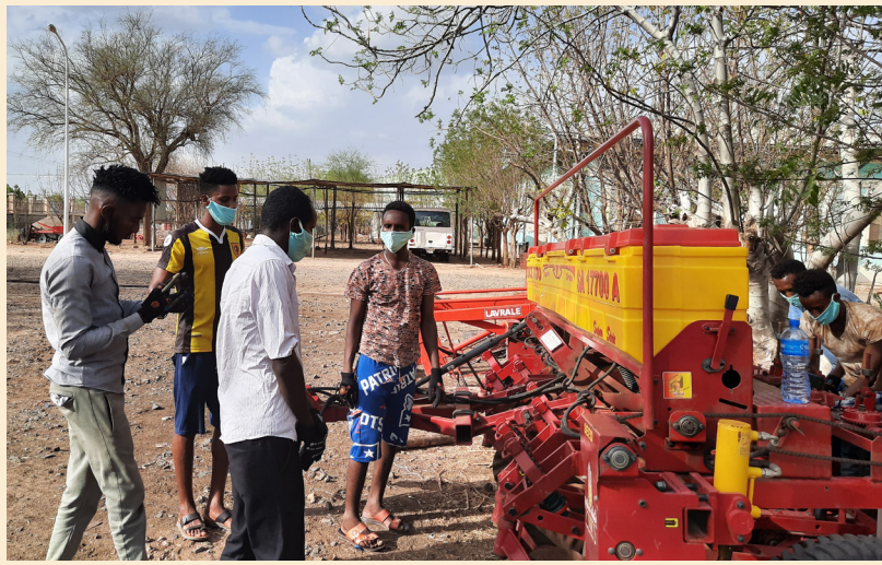
ማማይ ግሩፕ ናይ ሕርሻ ማሸነፊ ኣቅራቢ ምስ ማእከል ምርምር ሕርሻ ሑመራ ብምትሕብባር ን 15 ኣብ ቃፍታ ሑመራ ዝርከቡ ትራክተር ኣፕራተራት ብ ኣተሓሕዛ፣ ኣጠቓቕማ፣ ፅገናን ናይ መስመር መዝርኢ ንክልተ መዓልቲ ስልጠና ሂቡ።

ሓላፊ ሕርሻን ገዕር ልምዓትን ኣብቲ መጠቃለሊ እቲ ዋሳ ከምዝገለጸዎ ናይ ሰሊጥ መዳርግቲ ኣካላት ካብ ማንም ግዘ ንላዕሊ ብኮቪድ-19 ምክንያት ክበፀሕ ዝክእል ፀገም ንምምካት ተዋዳዶም ክሰርሑ ከምዝግቡኦ ኣተሓሳሲዮም። እቲ ዋሳ ብምትሕብባር ሽግግር ሕርሻን ቢሮ ሕርሻን ገዕር ልምዓትን ዝተካየደ እዩ። ኣብቲ ዋሳ ካብ 15 ንላዕሊ መዳርግቲ ኣካላት ካብ ክልል፣ ዞባ፣ ወረዳ፣ መሰረታዊ ሕብረት ስራሕ ማሕበራት፣ ዩንቨርሲቲ፣ ሕርሻ ምርምር፣ ኮሚሽን ድጋግን ጥዕና ቢሮ፣ ሰብ ሃፍቲ፣ ኣናኡሽተን ሓረስቶትን ካላኣትን ተሳተፎም።